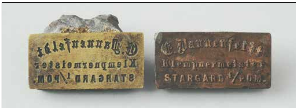
Ryc. 1. Awers stempla.